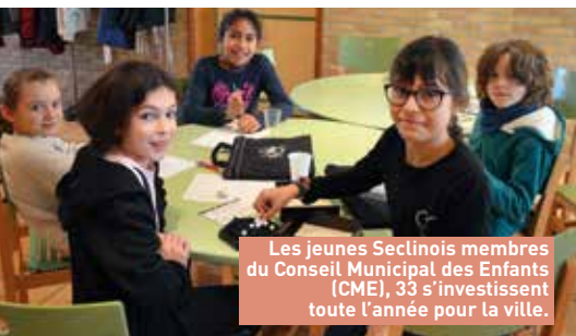
Les jeunes Seclinois membres du Conseil Municipal des Enfants (CME), 33 s'investissent toute l'année pour la ville.