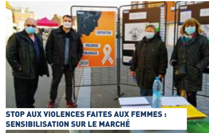
STOP AUX VIOLENCES FAITES AUX FEMMES : SENSIBILISATION SUR LE MARCHÉ

- Visite de Seclin sous l'angle du street art et de ses fresques et graffitis samedi 15 mai de 10h à 12h. Une visite inspirée par le prêt par la MEL de 50 oeuvres du peintre mexicain Cerutti bien connu à Seclin pour sa fresque sur le mur de l'école de musique donnant sur le parvis de l'école Jules-Verne, rue Abbé-Bonpain !