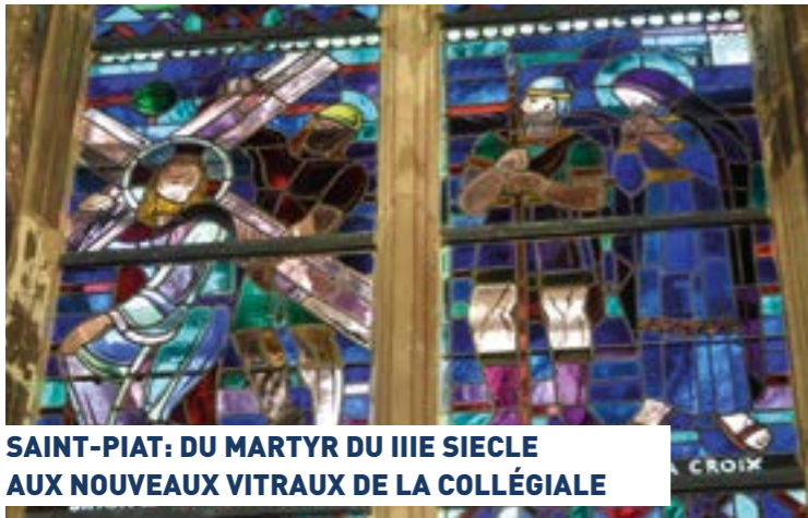
SAINT-PIAT: DU MARTYR DU IIIE SIECLE AUX NOUVEAUX VITRAUX DE LA COLLÉGIALE