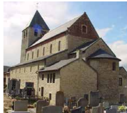
1 Église Saint-Pierre de Bertem (Belgique)

Depuis près d'un quart de siècle, les recherches menées par les équipes du Centre Archéologique de Seclin aux abords ou à l'intérieur de notre chère collégiale Saint-Piat, permettent aujourd'hui d'en restituer le plan au moment de sa construction aux alentours de l'an Mil.