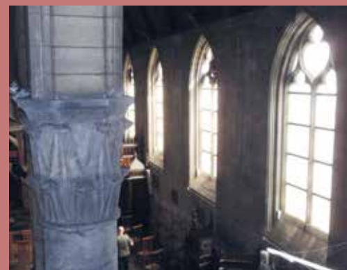
Le collatéral sud