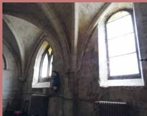
La salle capitulaire