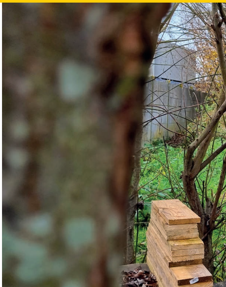
Des îlots de fraîcheur sont en cours de réflexion dans notre Commune.

Un projet conçu pour obtenir des résultats visibles et durables tant pour la planète que pour les Seclinoises et Seclinois. • RS