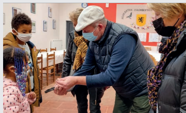
Une première participation pour les coulonneux seclinois.