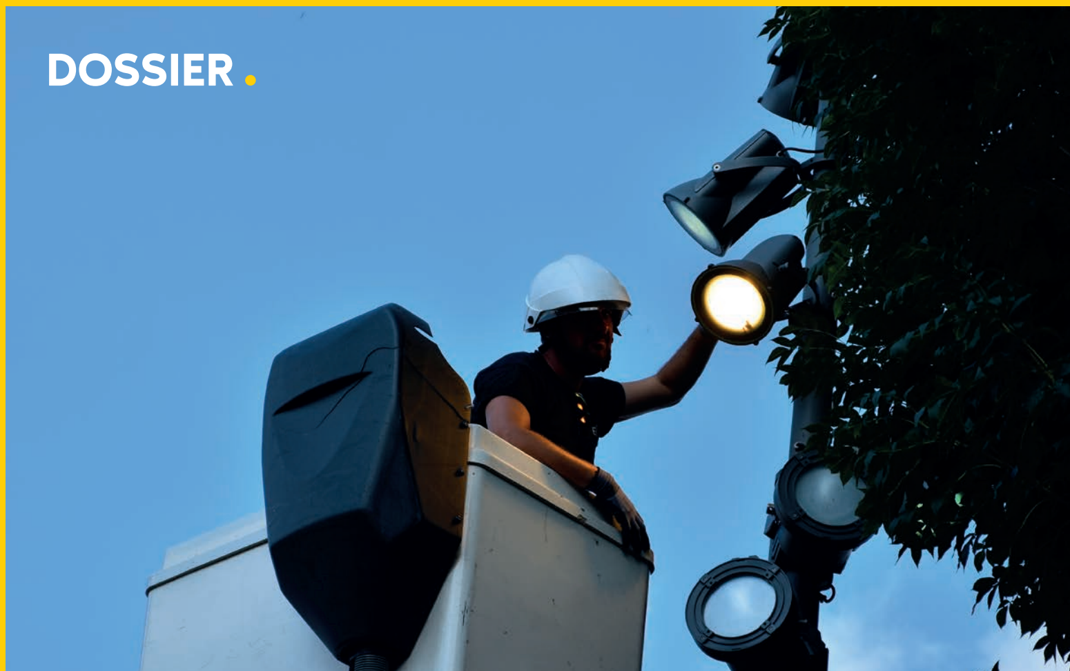
L'intensité des lumières de la Ville sera diminuée la nuit pour protéger la biodiversité.