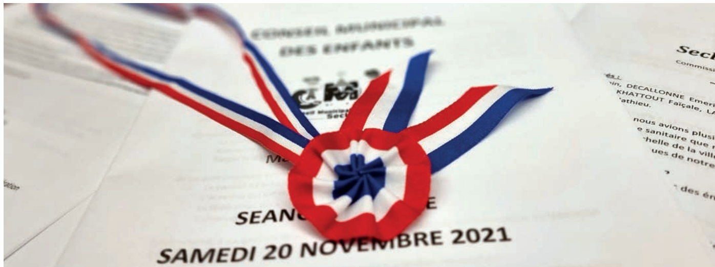
Les 33 jeunes élus ont voté quatre projets lors de leur instance plénière.