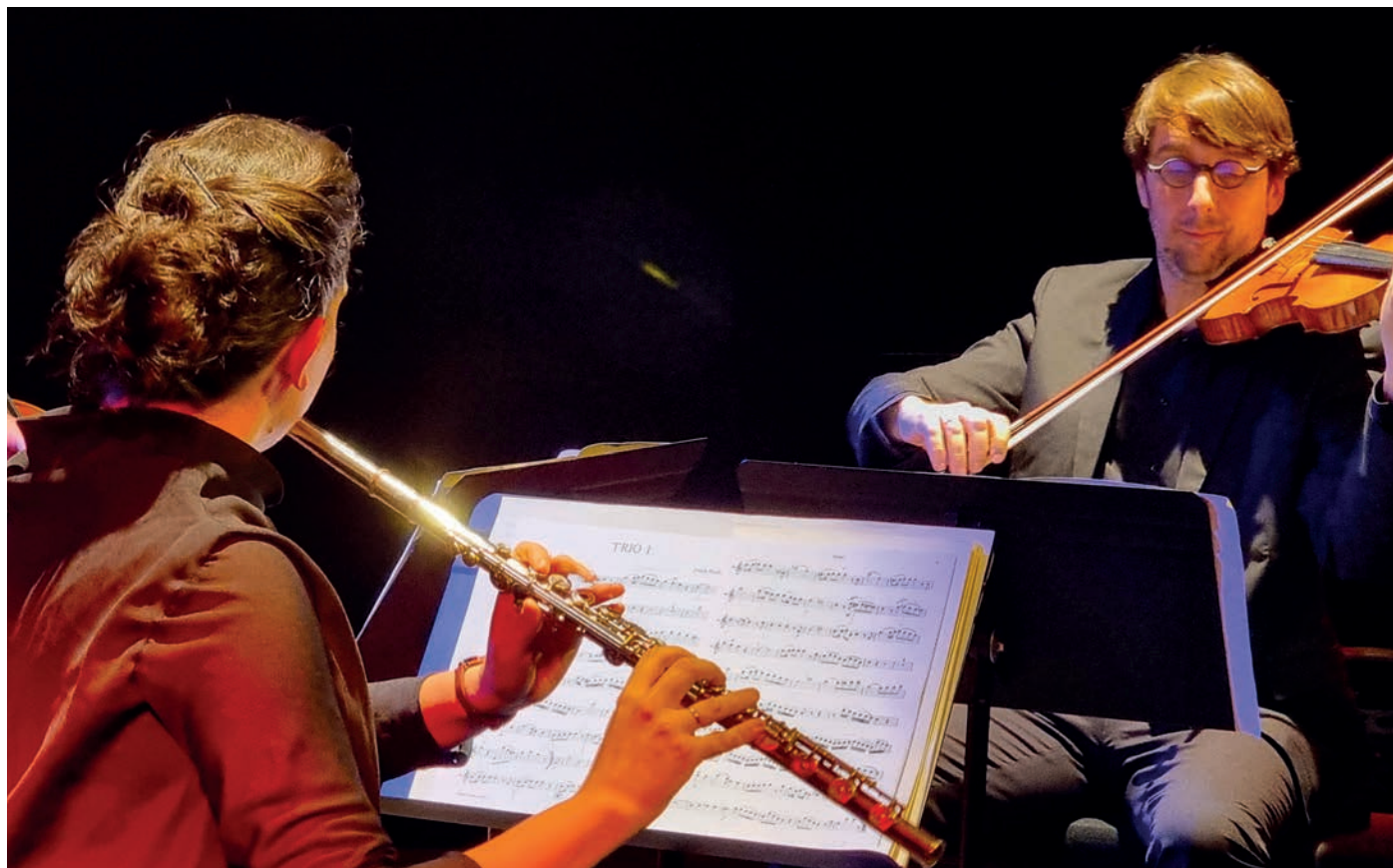
L'Ensemble Pucsum a ébloui le public avec son concert de musique de chambre.