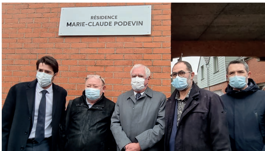
Les 11 logements accueilleront à nouveau des familles modestes.