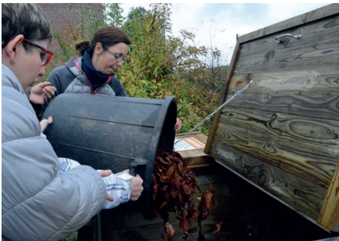
Une centaine de nouveaux composteurs vont être distribués en janvier 2022.

Saviez-vous que vos poubelles ont de la valeur ? Grâce au compostage, les déchets organiques sont transformés en un produit riche en éléments nutritifs pour le sol. Dans le cadre de sa politique de réduction des déchets, la MEL, en lien avec la Ville, mettra à disposition des foyers seclinois fin janvier 100 composteurs de 400 litres (plus son bio-seau, sa grille anti-rongeurs et sa tige aérateur) avec notice et guide pratique. L'expérience permet aux citoyens de comprendre l'impact du compostage sur la réduction des ordures ménagères. • DB