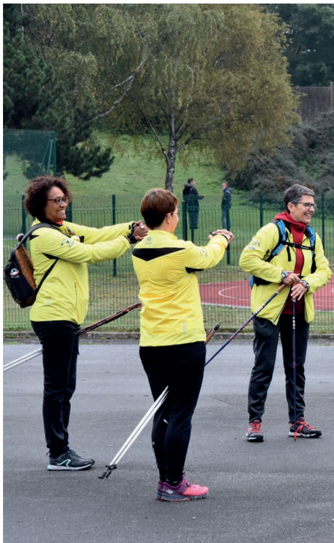
La marche nordique est un sport adapté à tous les âges.