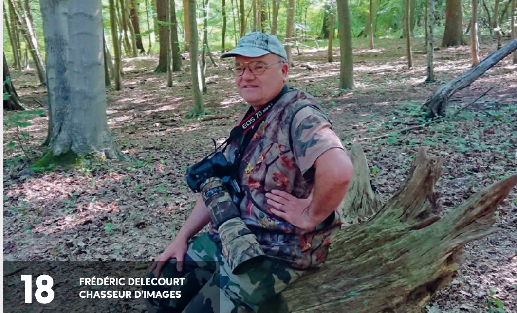
18 FRÉDÉRIC DELECOURT CHASSEUR D'IMAGES

Directeur de la publication : François-Xavier Cadart