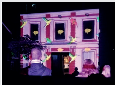
Une des œuvres seclinoises de vidéo-mapping projetées le 15 octobre à Haubourdin.