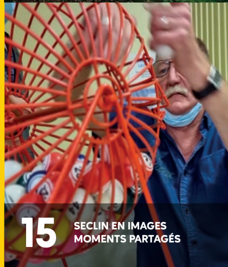
15 SECLIN EN IMAGES MOMENTS PARTAGÉS