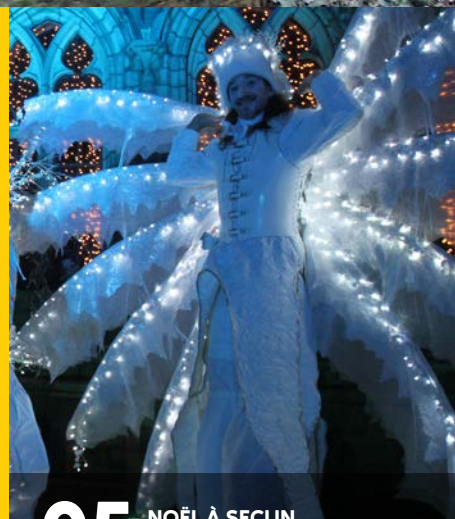
05 NOËL À SECLIN MODE D'EMPLOI