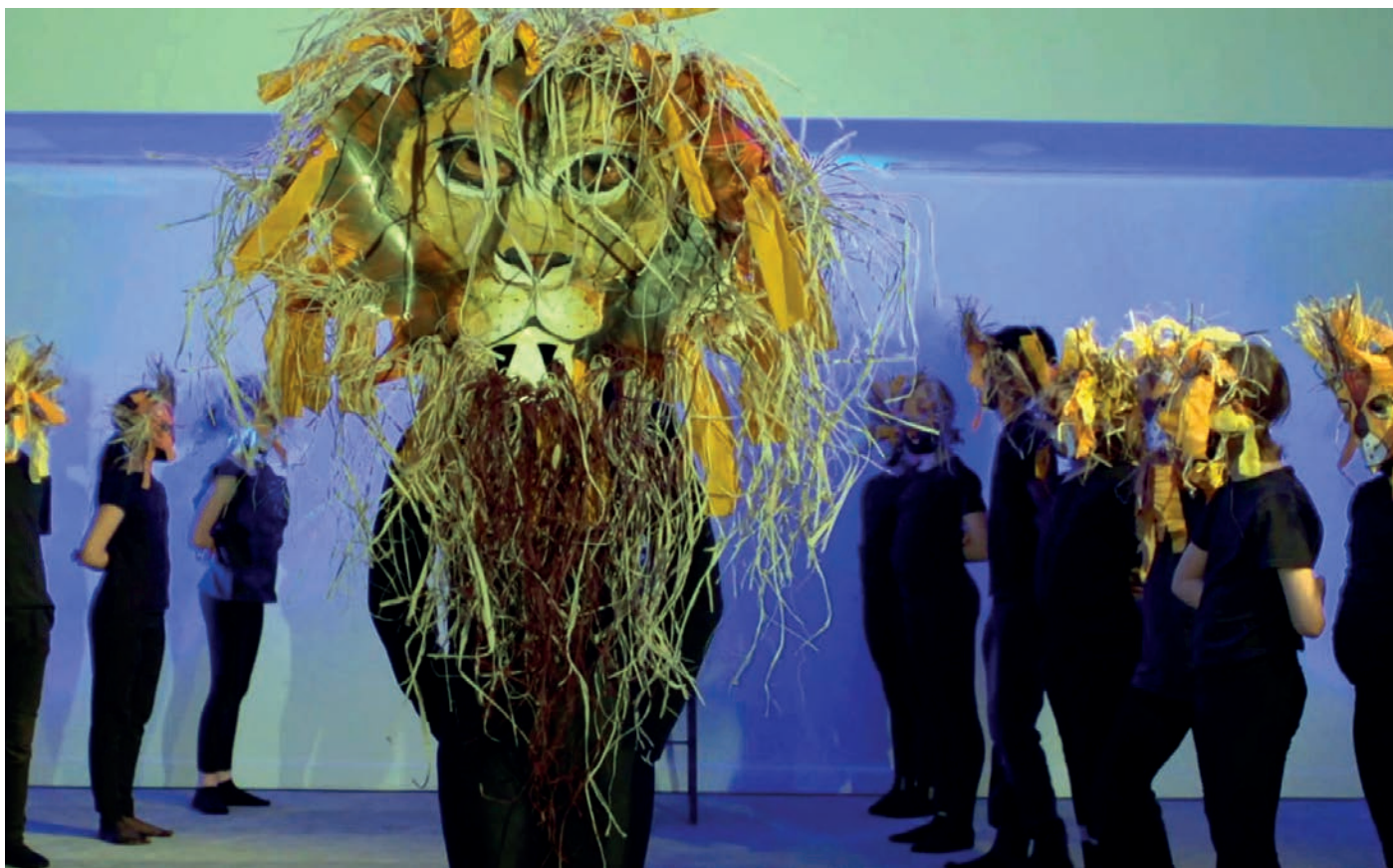
Les enfants ont interprété le "Carnaval des Animaux" de Saint-Saëns.