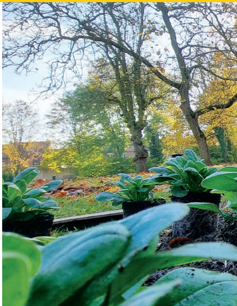
Les espaces verts sont fleuris selon les différentes saisons.