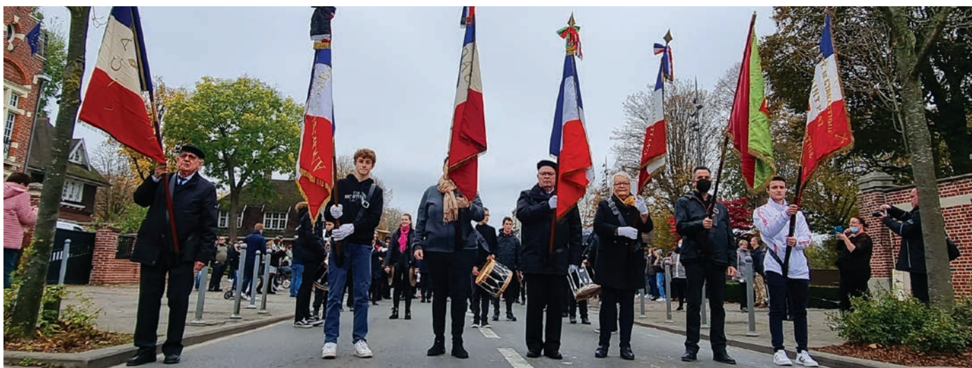
Une commémoration où se sont retrouvées quatre générations de Seclinois.