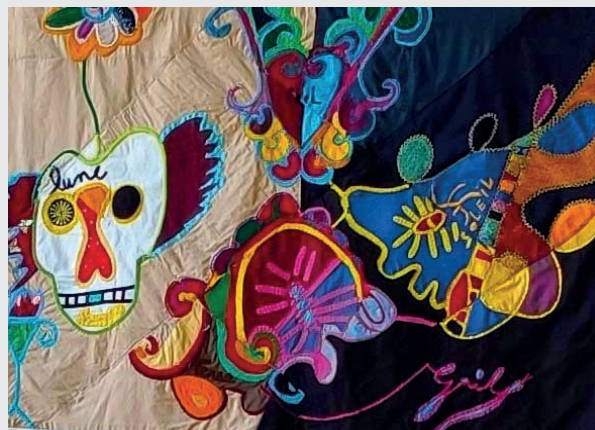
L'œuvre en tissu créée par l'Atelier Fait Main.

+ D'INFOS L'Atelier Fait Main. Politique de la Ville, 03.20.32.28.28.