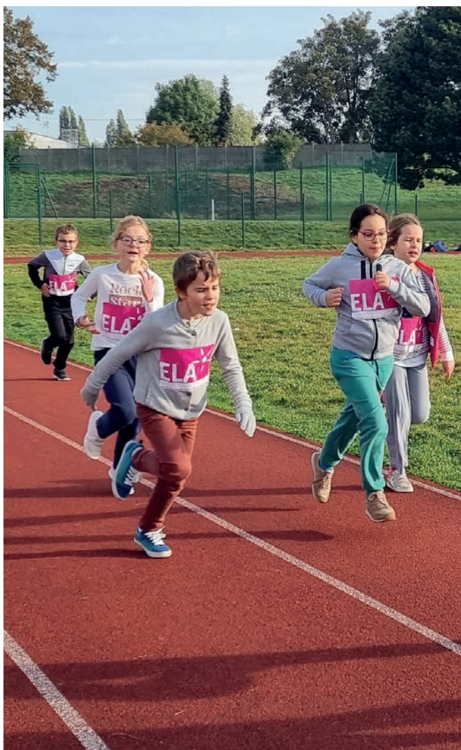
Les élèves ont prêté leurs jambes aux enfants malades.