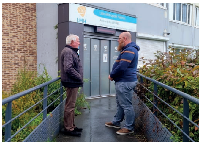
Lille Métropole Habitat, un des partenaires du Service Logement.

Ces espaces permettront aux voisins de se rapprocher, d'alléger la charge psychologique de tous ceux qui sont en télétravail ou obligés de rester à la maison pour des raisons personnelles.