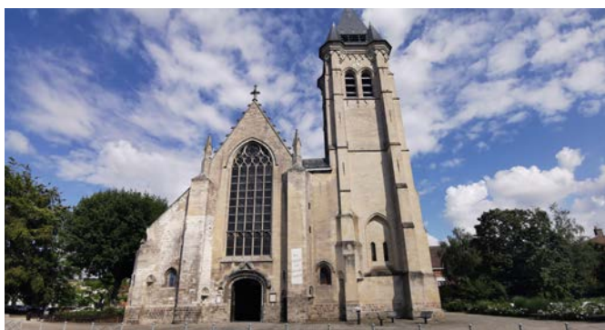
La 3 e phase de restauration se fera au cours de ce mandat.

+ D'INFOS Colette Coignion, 06.70.32.21.72