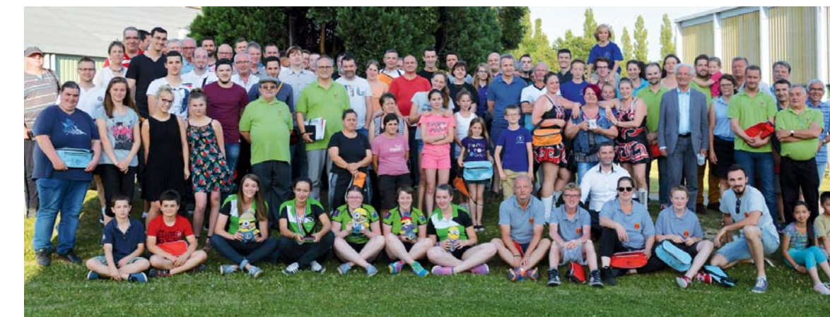
Photo de famille à l'issue de la cérémonie des «Podi'OMS» portée par l'Office Municipal des Sports.

Lundi 29 juin, salle Paul-Durot, les membres de l'Office Municipal des Sports (OMS) et leur président, Éric Corbeaux, ont orchestré la cérémonie des sportifs méritants, baptisée « Podi'OMS 2015 ». Un moment chaleureux de fin de saison qui a mis à l'honneur 80 sportifs de tous âges issus de nombreuses disciplines, et une quinzaine de bénévoles. Une cérémonie qui s'est déroulée en présence du maire, Bernard Debreu, et de nombreux élus.