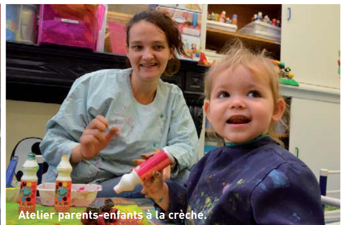
Atelier parents-enfants à la crèche.