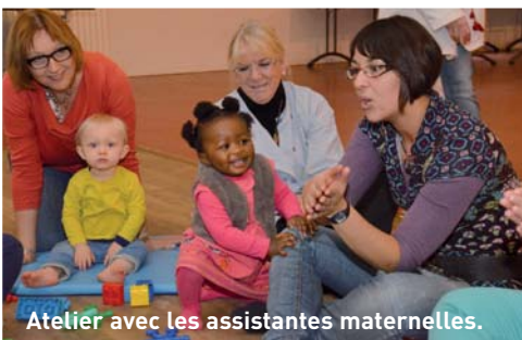
Atelier avec les assistantes maternelles.