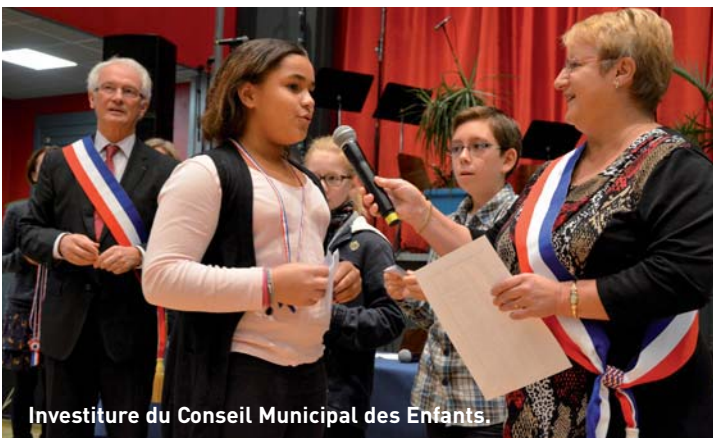
Investiture du Conseil Municipal des Enfants.