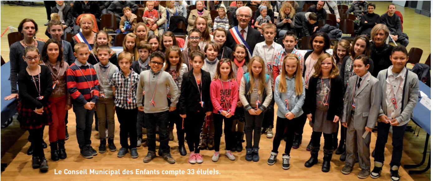
Le Conseil Municipal des Enfants compte 33 élu(e)s.