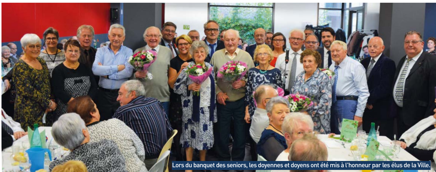
Lors du banquet des seniors, les doyennes et doyens ont été mis à l'honneur par les élus de la Ville.

Dimanche 19 novembre, au restaurant Paul-Langevin, 269 retraités seclinois ont fêté les prémices de Noël, lors du banquet des seniors offert par la Ville à tous les retraités... À Seclin, en effet, aucune restriction d'âge, contrairement à la plupart des communes : pour participer au banquet ou pour recevoir l'un des 1.250 colis de Noël, il faut seulement être retraité.