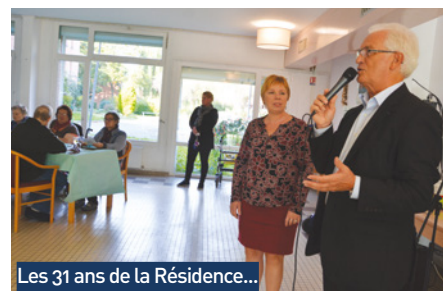
Les 31 ans de la Résidence...

Pour tout renseignement sur la Résidence et ses logements, n'hésitez pas à téléphoner au 03.20.32.20.30 ou à vous rendre sur place avenue des Marronniers (près de l'entrée du canal de Seclin).