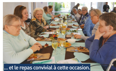
... et le repas convivial à cette occasion.