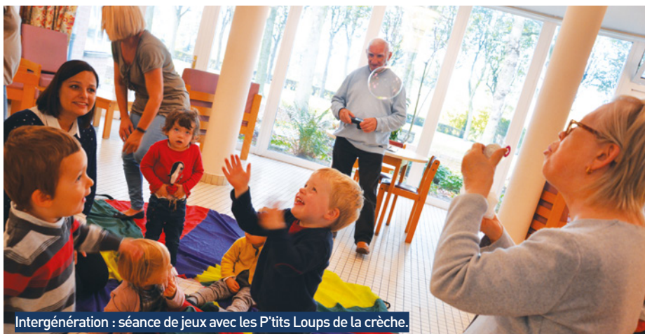
Intergénération : séance de jeux avec les P'tits Loups de la crèche.

L'animation tient aussi une grande place à la Résidence Sacleux. On se souviendra longtemps de la Semaine Bleue 2017, par exemple, et de l'extraordinaire final en chansons françaises et accordéon. Mais les animations, ce n'est pas uniquement une semaine par an, c'est