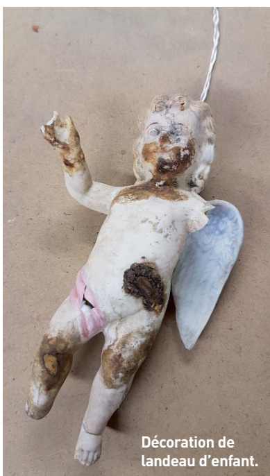
Décoration de landeau d'enfant.