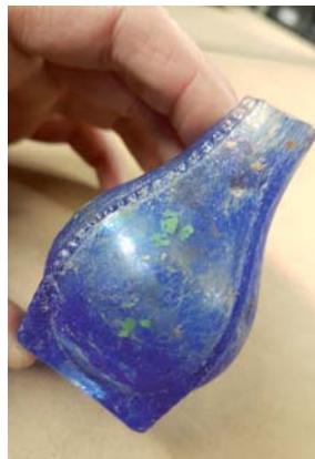
Flacon à parfum.