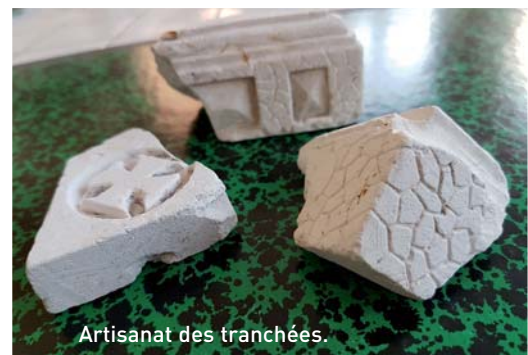
Artisanat des tranchées.