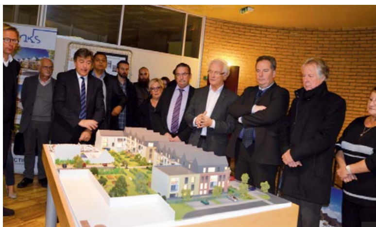
La maquette du projet Lincrusta, présentée le 8 novembre, est visible à l'Hôtel de Ville.

Les habitants bénéficieront donc d'un cadre de vie agréable proche du centre-ville et à deux pas de la gare qui, d'ici là, sera devenue un véritable pôle d'échanges. D'ailleurs, une large avenue traversera la résidence de part en part et permettra la circulation de bus. De nombreuses places de stationnement sont également prévues : 214 places pour les résidents, 63 pour le public,