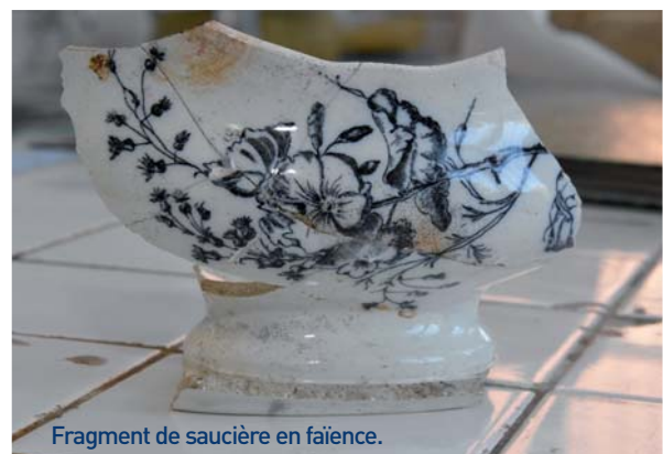
Fragment de saucière en faïence.