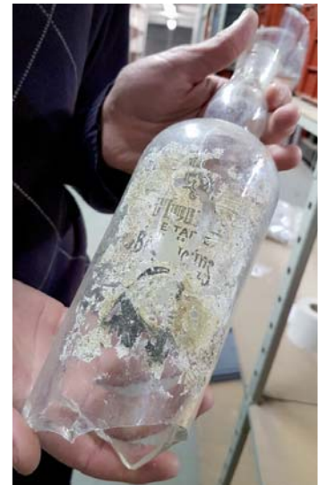
Bouteille d' « Huile de table des Bénédictins » produite à Seclin.