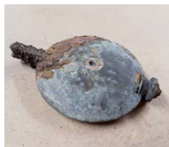
Briquet de Poilu.