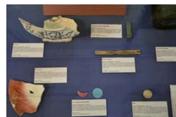
Une partie des objets exposés par le centre archéologique.

Les Seclinois peuvent découvrir la maquette du projet Lincrusta et l'exposition du centre archéologique au 1 er étage de l'Hôtel de Ville, au service urbanisme, jusqu'au mardi 22 novembre aux horaires d'ouverture de la mairie, de 8h30 à 12h et de 13h30 à 17h la semaine et de 8h30 à 12h le samedi. Renseignements : 03.20.62.91.22.