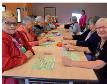
Le 4 octobre, une bonne cinquantaine de personnes ont participé à un loto.