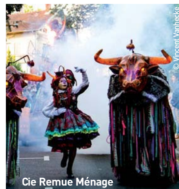
Cie Remue Ménage

La Fête des Harengs, dimanche 26 juin. De 11 h à 19 h sur la drève : campement médiéval. À 14 h 30, concert de percussions urbaines. À 15 h, départ du cortège depuis les jardins de l'Hôpital Marguerite de Flandre. Passage avenue des Marronniers, rues Marx-Dormoy, Carnot, boulevard Hentgès-Bouvry. Arrivée sur la drève. À 17 h 30, concert de la chorale Tous en Chœur. Accès libre et gratuit. Venez à pied, car il sera interdit de circuler et de stationner sur le parcours.