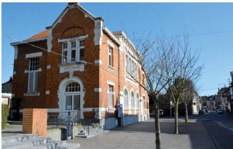
L'ancienne Trésorerie, rue Jean-Jaurès, sera réaménagée pour accueillir la Police Municipale et le Service Culture de la Ville.