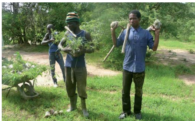
Le projet de reforestation est engagé à Méguet.