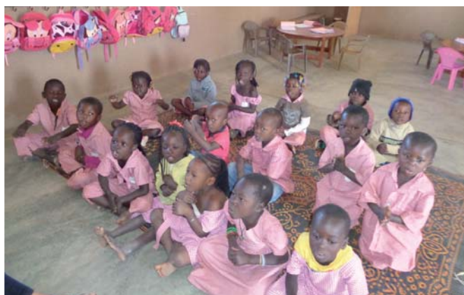
Une troisième classe a été créée à l'école maternelle de Méguet. Elle sera bientôt équipée grâce à la solidarité tissée avec les Seclinois.