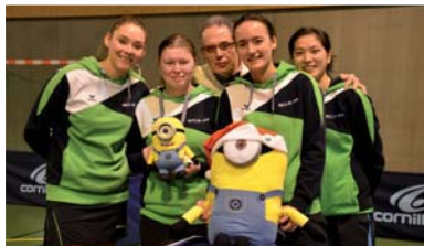
Les Seclinoises avec le président du PPP

Malgré un engagement et un dynamisme hors pair, les filles de l'équipe de Nationale 2 du Ping Pour Prétexte n'ont pu enrayer la machine infernale d'Etival (Vosges), samedi 27 février, dans la salle Jacques Secrétin (score final : 0 à 8). À noter : le prochain rendez-vous du PPP aura lieu le samedi 26 mars à la salle Jacques Secrétin pour un grand tournoi sport adapté qui marquera les 10 ans de