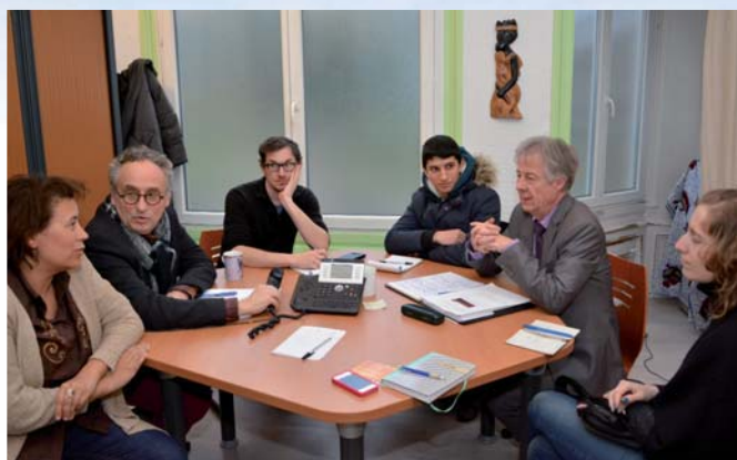
Une réunion de travail a permis de faire le point, le 18 février, sur les actions en cours avec Méguet.

Le groupe de jeunes Seclin-Méguet, créé en 1986 par la Ville et qui a concerné plusieurs générations de jeunes, a réalisé nombre d'équipements dans notre ville jumelle au Burkina Faso (maternité, dispensaire, collège, écoles...) et mis en œuvre des actions de solidarité. Si vous souhaitez rejoindre le groupe Seclin-Méguet pour participer à ses activités à Seclin et pour préparer un séjour à Méguet, vous pouvez contacter le service Enfance Jeunesse de la Ville au château Guillemaud, 03.20.62.94.42.