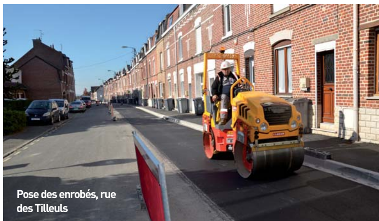
Pose des enrobés, rue des Tilleuls

réfection des trottoirs, côté pair de la rue des Tilleuls. En ce qui concerne le renouvellement des conduites d'eau potable rue du 14-Juillet et rue Marcel-Cachin, les travaux sont menés pour le compte des