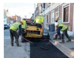
Réalisation des enrobés rue du 14-Juillet

Pour des raisons de sécurité, l'ancien manège à chevaux, la voûte, le château d'eau et des locaux de stockage sont en cours de démolition au parc de la Ramie.