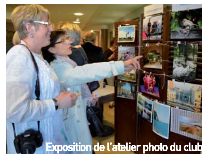
Exposition de l'atelier photo du club

La rentrée du club informatique aura lieu le mercredi 23 septembre à 18h, à l'OIFT, 80 rue Roger-Bouvry. Au cours de cette réunion du 23 septembre, les responsables du club répondront à toutes vos questions et présenteront le planning de l'année. Le club est ouvert à toutes et tous, débutants et expérimentés. Les séances ont lieu le mardi, le mercredi et le jeudi. Vous serez initié à Excel, Word, Internet, Powerpoint, Publisher. Depuis 12 ans, un atelier est ouvert pour le traitement de la