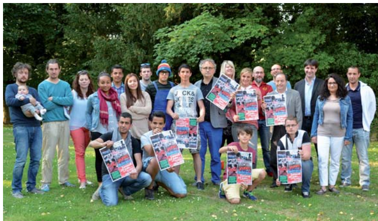
Le collectif qui a préparé Festi'Jeunes vous donne rendez-vous ce samedi 20 juin.

Les plus acrobates pourront goûter aux sensations de la slackline, une activité très « tendance » qui consiste à marcher et rester en équilibre sur un fil accroché entre deux arbres face à la salle des fêtes. L'association Ride On Lille prêtera gratuitement des rollers (et ses protections) à ceux qui, dès 6 ans, souhaitent essayer cette activité (rue des Bourloires). À l'extérieur aussi, aux alentours de la salle des fêtes, seront proposés des tournois de « foot de rue » et des jeux traditionnels. Un atelier « graff et écriture » permettra aux jeunes de s'exprimer sur grand format grâce à des lettrages ou des dessins... « Aux jeunes de choisir ! », précise l'un des animateurs responsable de cette activité créative. D'ailleurs, les jeunes qui le souhaitent pourront, à partir de leur texte, tester leur voix au micro.