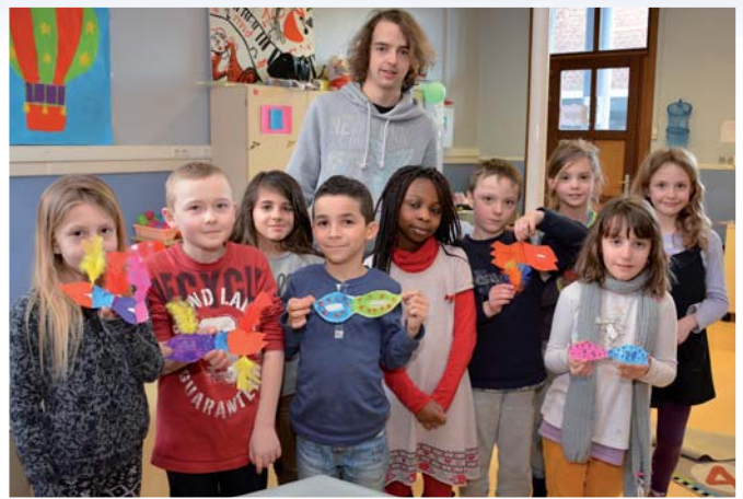
Les 6-8 ans se sont intéressés aux carnivals de Venise et de Rio.