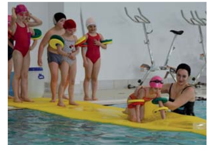
Grand jeu à la piscine municipale.