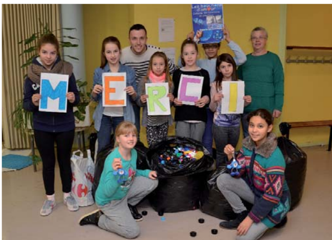
Des 9-11 ans ont animé une collecte de bouchons pour une association qui vient en aide aux personnes handicapées. Ils disent merci aux donateurs !