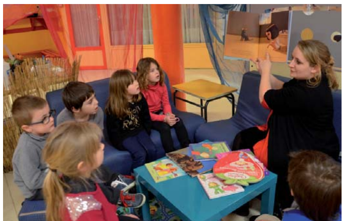
Chez les 4-5 ans, lecture d'un livre suite à la découverte, au Louvre-Lens, de l'exposition « Des animaux et des pharaons ».