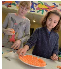
Une assiette de Top Chef !