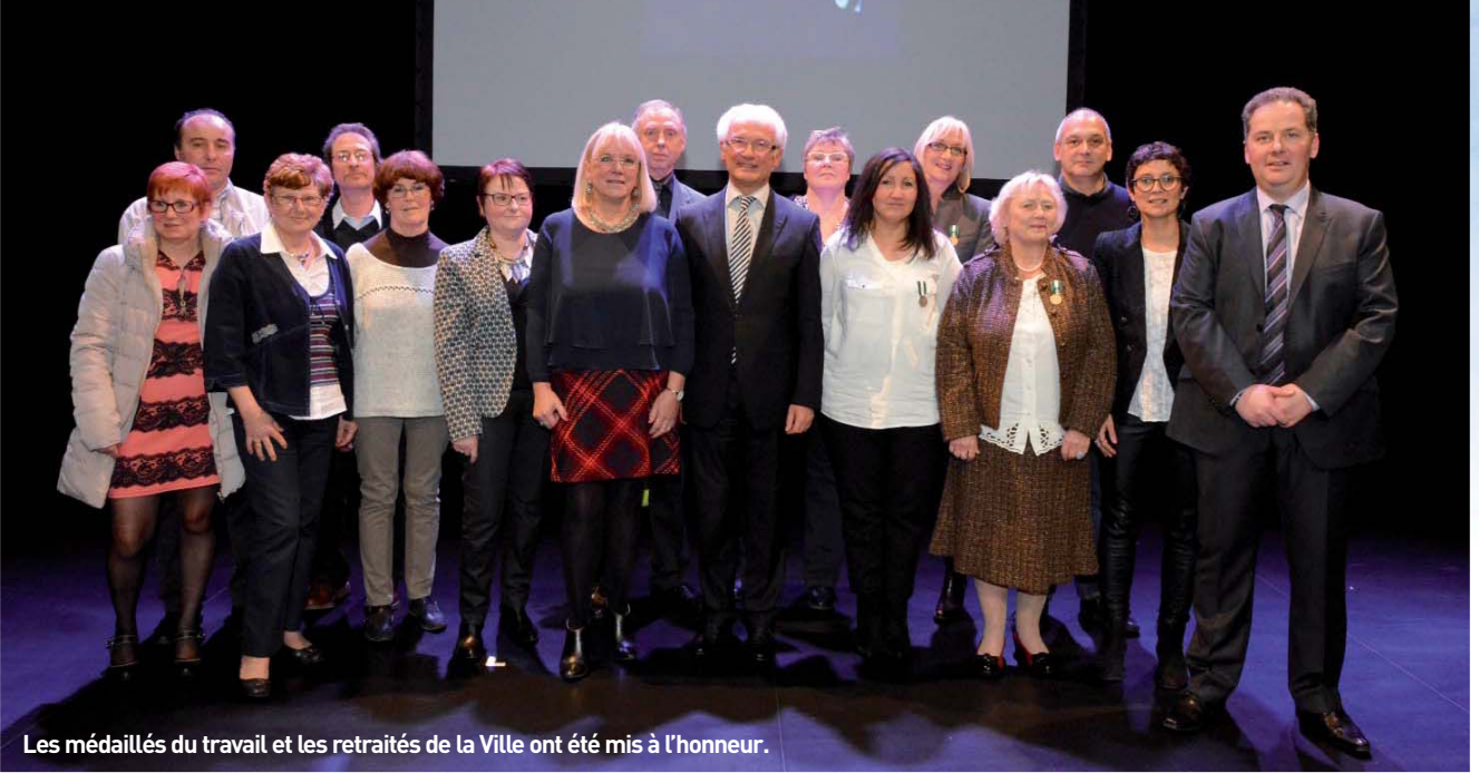
Les médaillés du travail et les retraités de la Ville ont été mis à l'honneur.