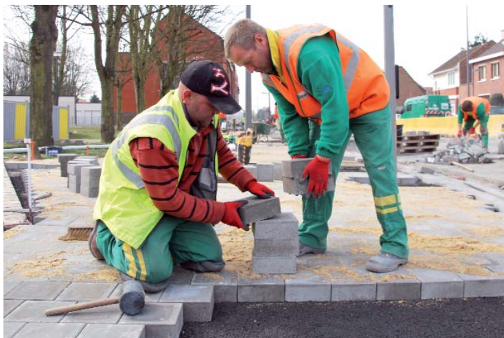
La Ville assure l'accompagnement des travaux de voirie financés par LMCU sur l'axe Hentgès-Bouvry notamment (espaces verts, éclairage public...).